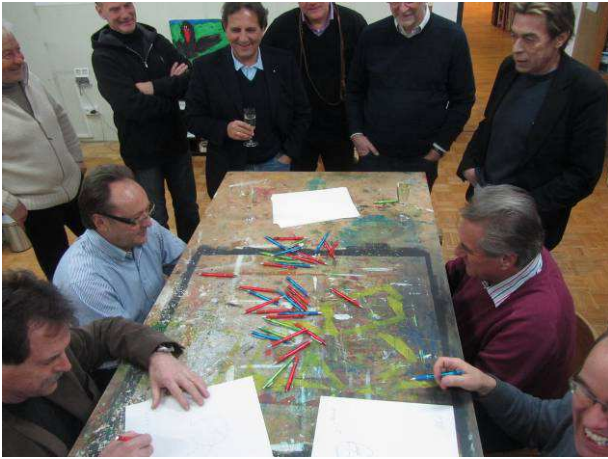
Der lustige Einstieg in den gelungenen Abend