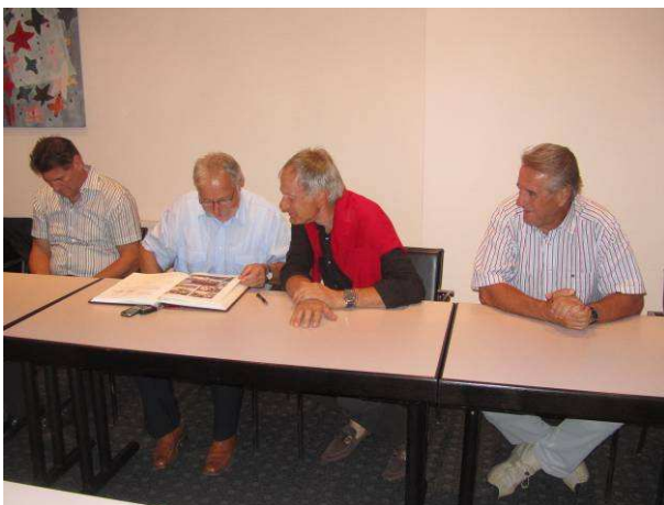
Das Gästebuch stößt bei den Mitgliedern immer wieder auf großes Interesse. Viele schöne Erinnerungen werden dadurch# wachgehalten