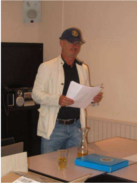
Der Präsident eröffnet den Clubabend und stellt die AC-Kappe vor, welche beim NAC gekauft werden kann.