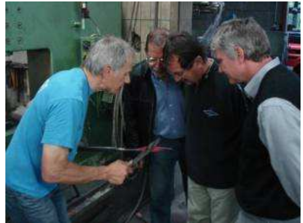
Der Meister zeigte, was als Fachmann alles möglich ist