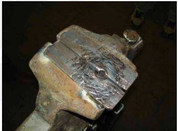
So sieht ein Amboss nach der Bearbeitung durch den AC aus